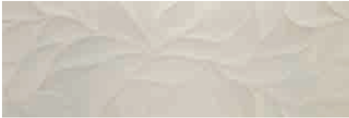
Leaves Avenue Gris 30 x 90 cm.