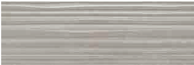
Track Avenue Gris 30 x 90 cm.