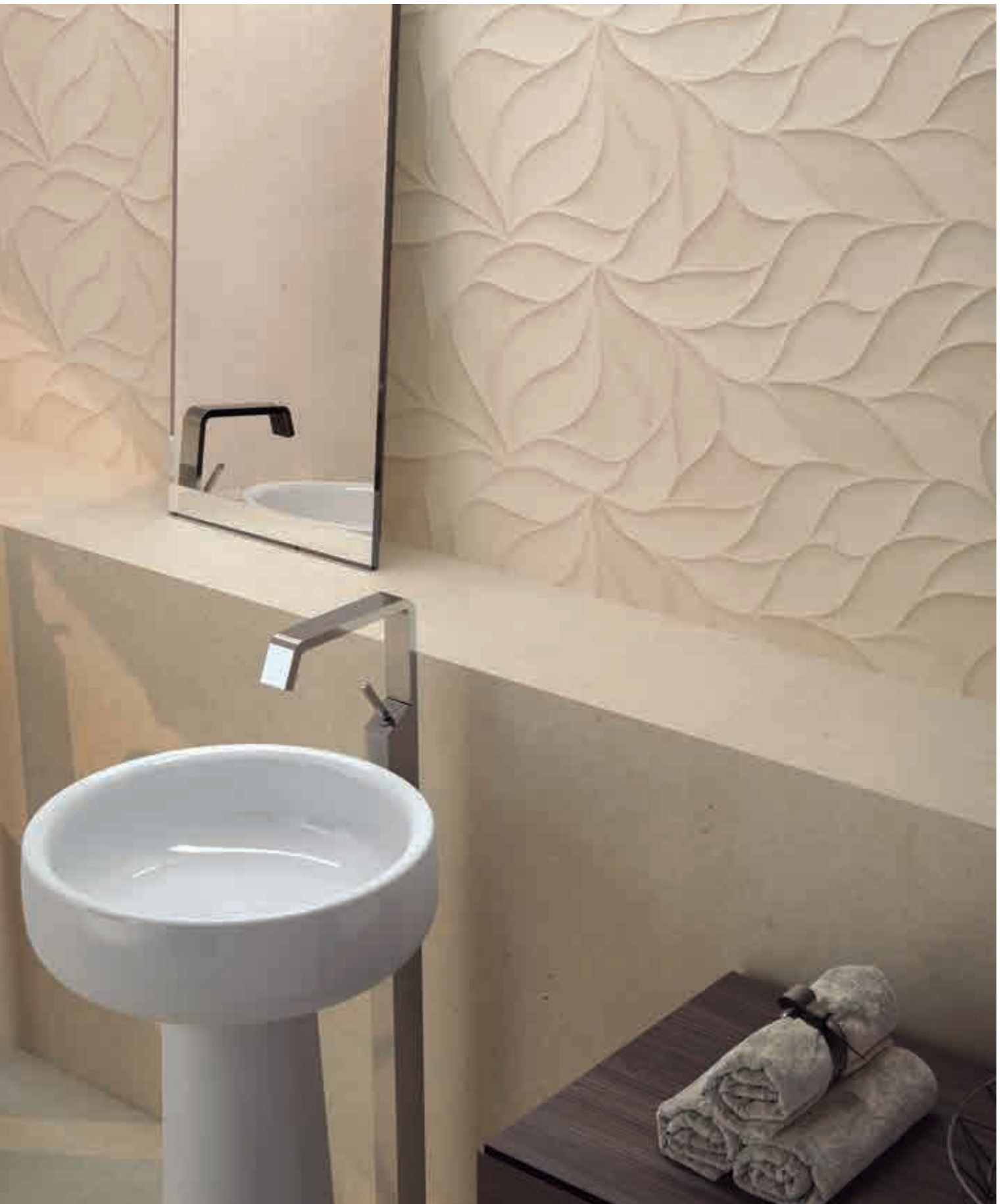
Avenue Beige 30 x 90 cm. Leaves Avenue Beige 30 x 90 cm. Pavimento Avenue Beige 60 x 60 cm.