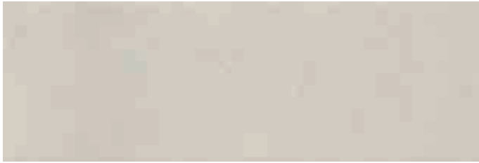
Avenue Gris 30 x 90 cm.