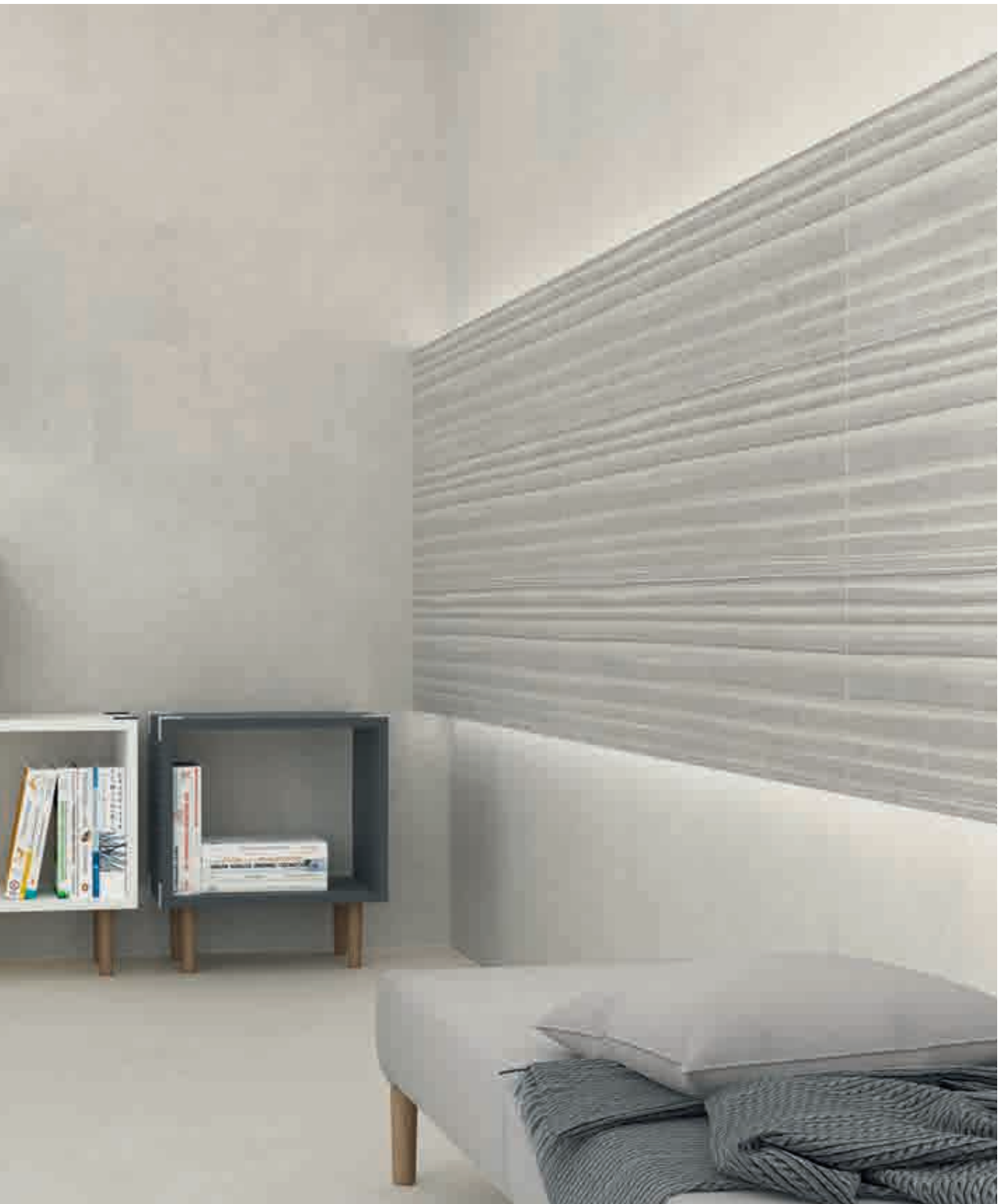
Avenue Gris 30 x 90 cm. Track Avenue Gris 30 x 90 cm. Pavimento Avenue Gris 60 x 60 cm.