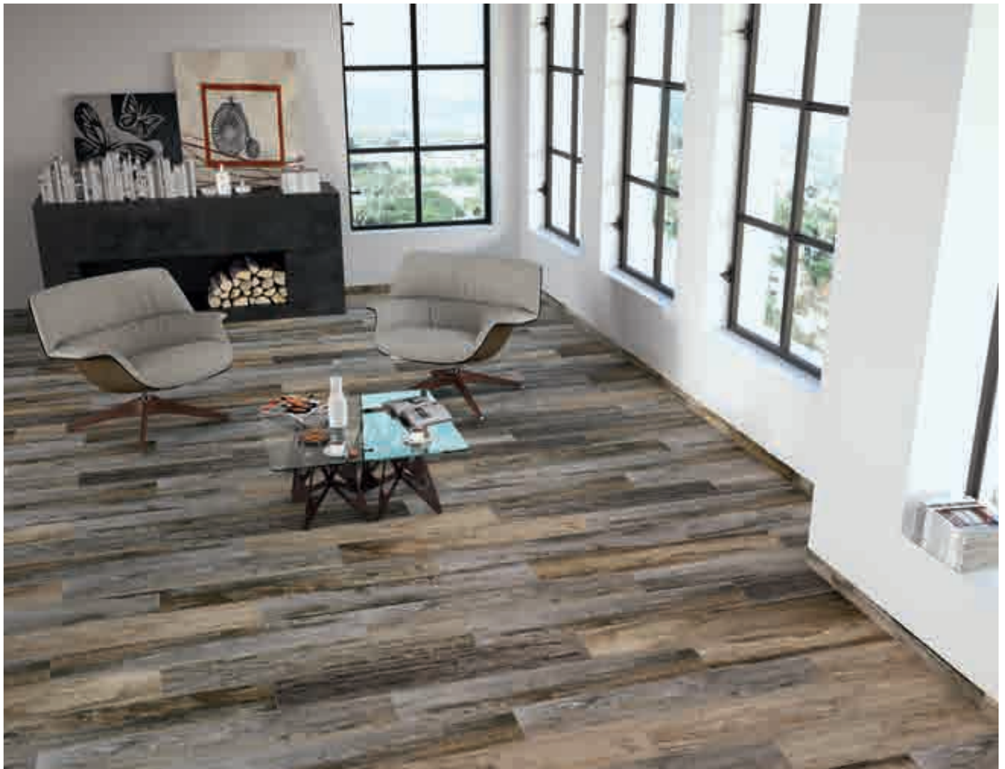
Barnwood 20 x 114 cm. Rodapié Barnwood 10 x 57 cm.

Se aconseja uso del Sistema Nivelado We recommend using Leveling System to fix the tiles Ver pag. 306