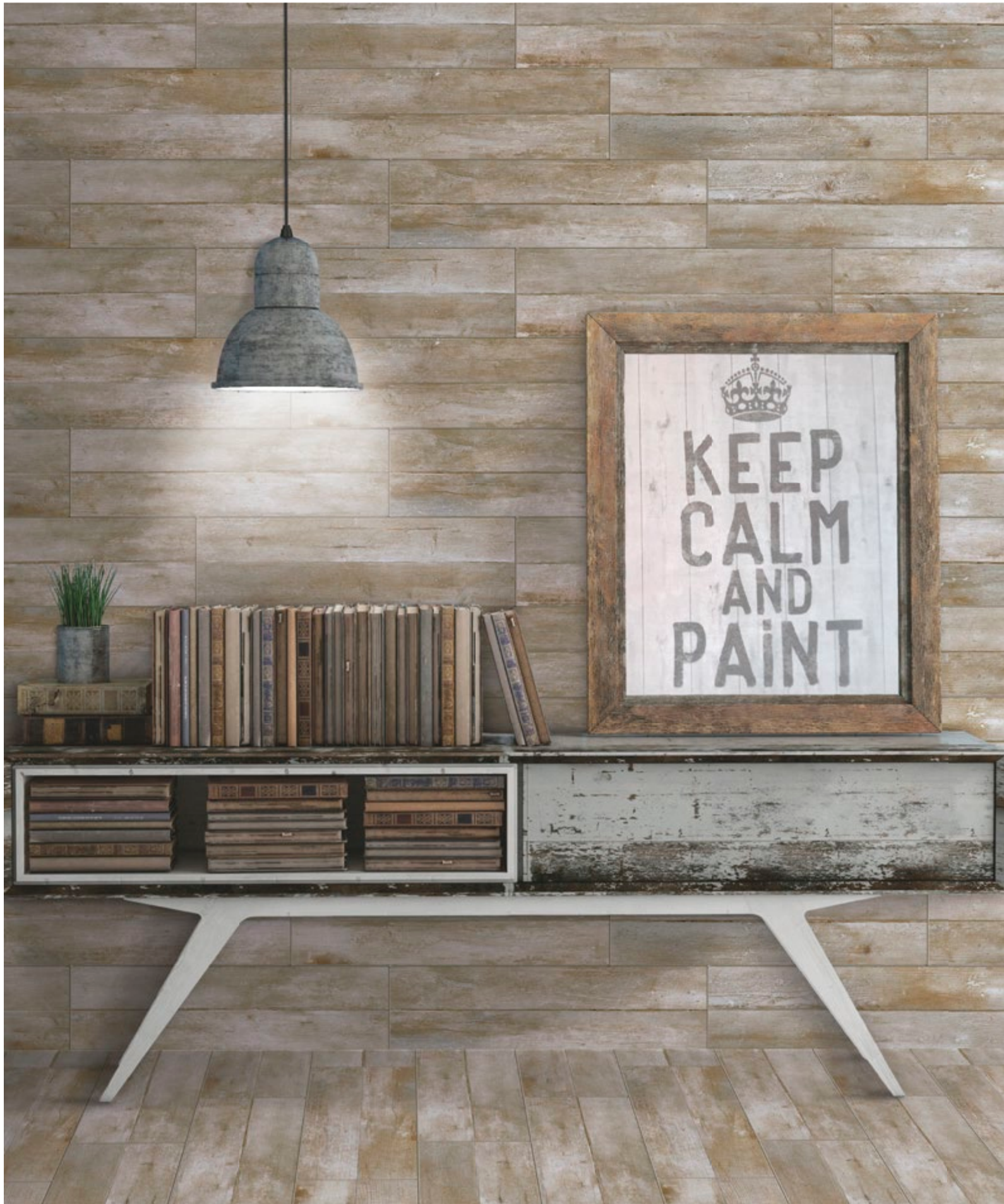
PAVIMETO DE GRES: 25X92 | ARAL.