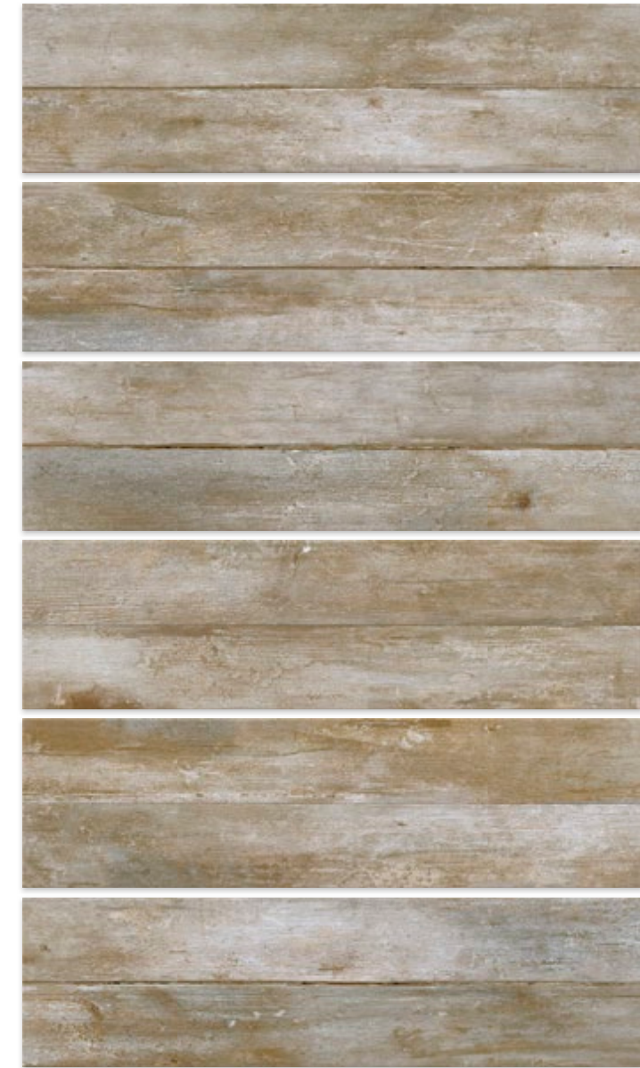
ARAL 25 X 92 / 10" X 36"