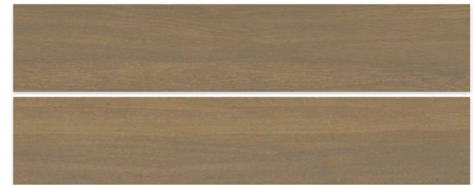
DOUGLAS WENGUÉ 23 X 120 / 9" X 47"