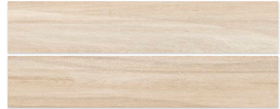
DOUGLAS ARCE 23 X 120 / 9" X 47"