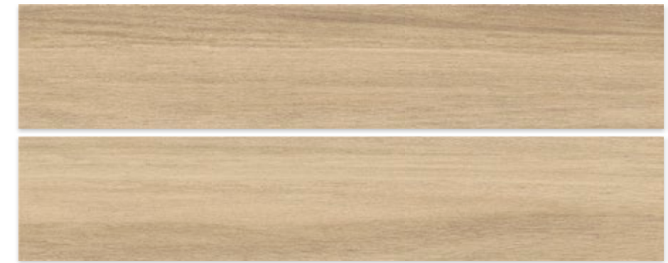
DOUGLAS TORTORA 23 X 120 / 9" X 47"