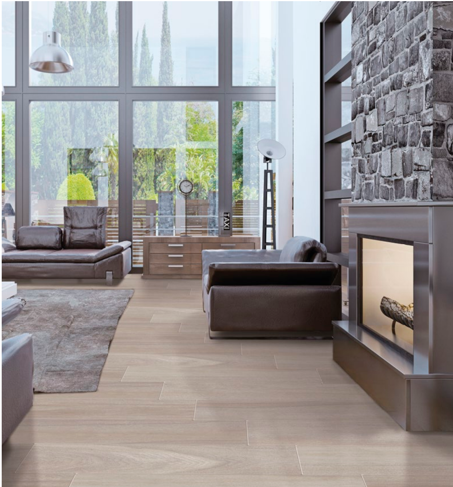
PORCELÁNICO: 23X120 | DOUGLAS ARCE.