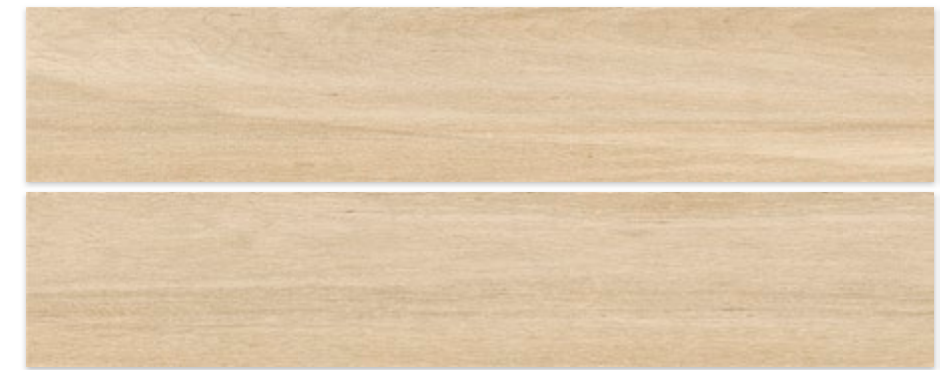
DOUGLAS ROBLE 23 X 120 / 9" X 47"