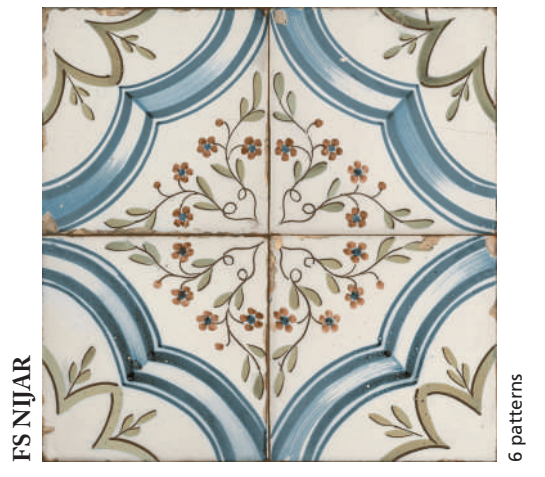
FS NIJAR 6 patterns