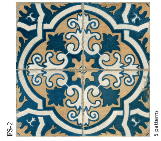
FS-2 5 patterns