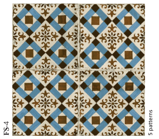
FS-4 5 patterns