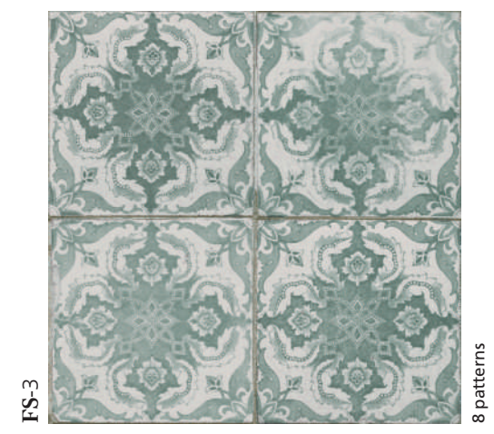
FS-3 8 patterns