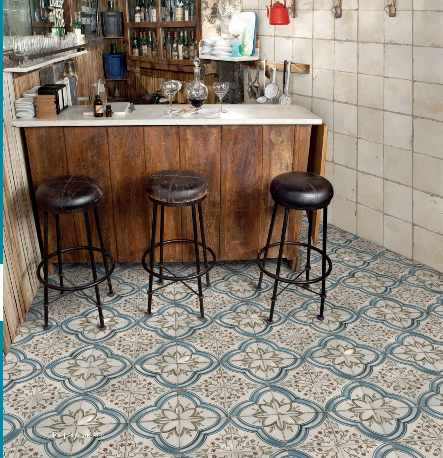
FS | FS NIJAR | FS-0