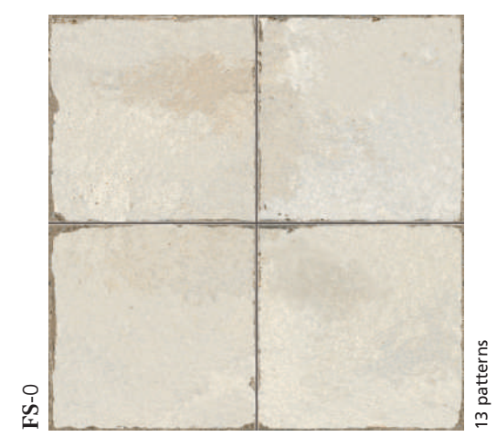
FS-0 13 patterns