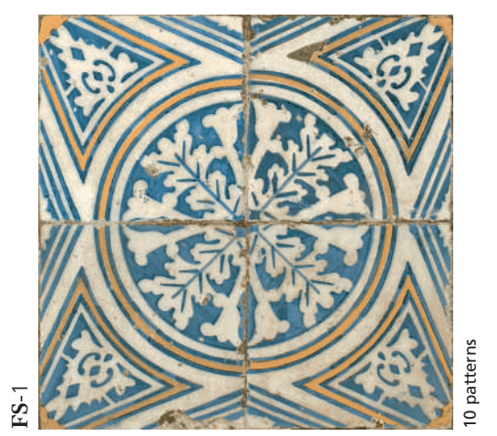
FS-1 10 patterns