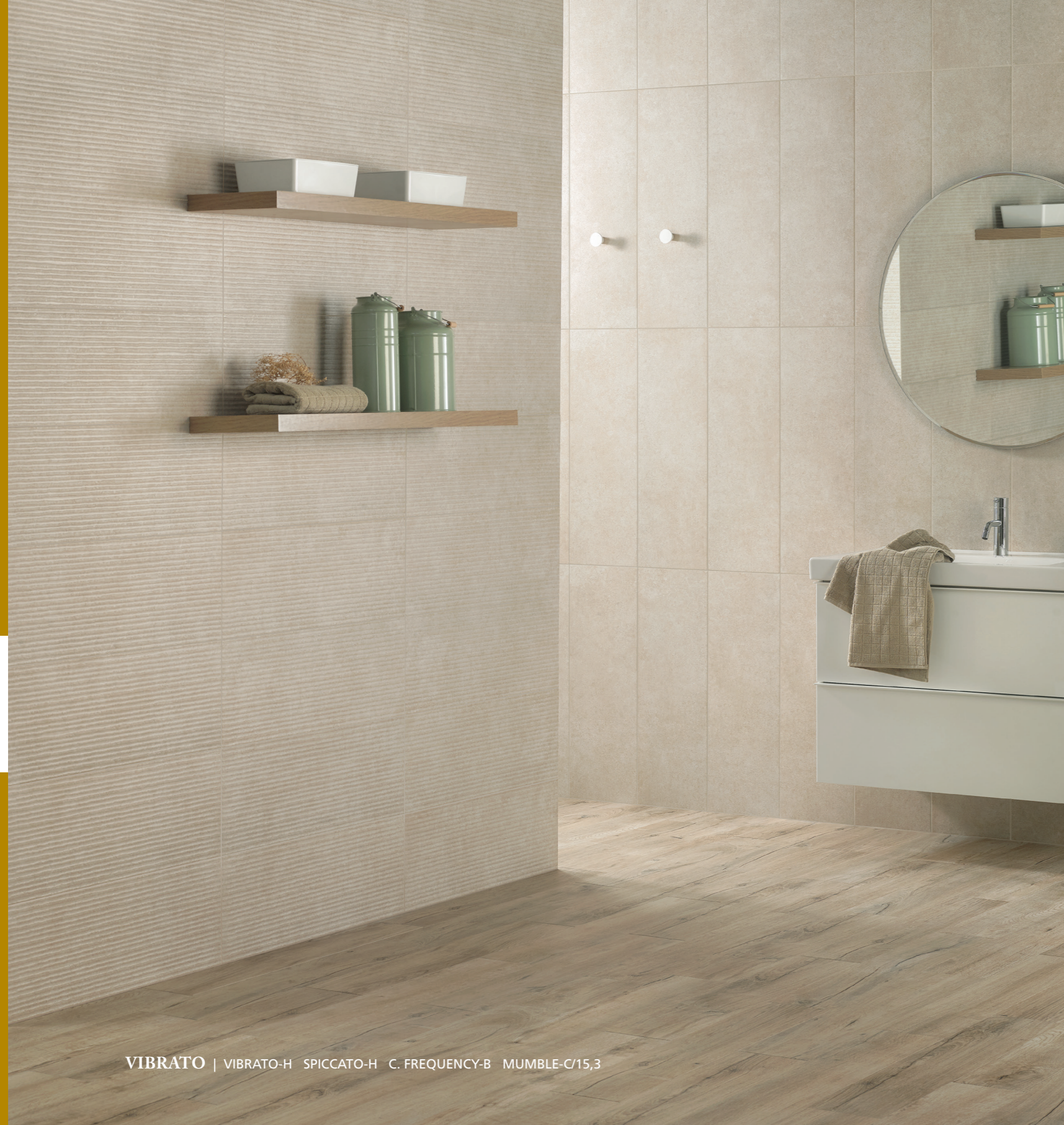
VIBRATO | VIBRATO-H SPICCATO-H C. FREQUENCY-B MUMBLE-C/15,3