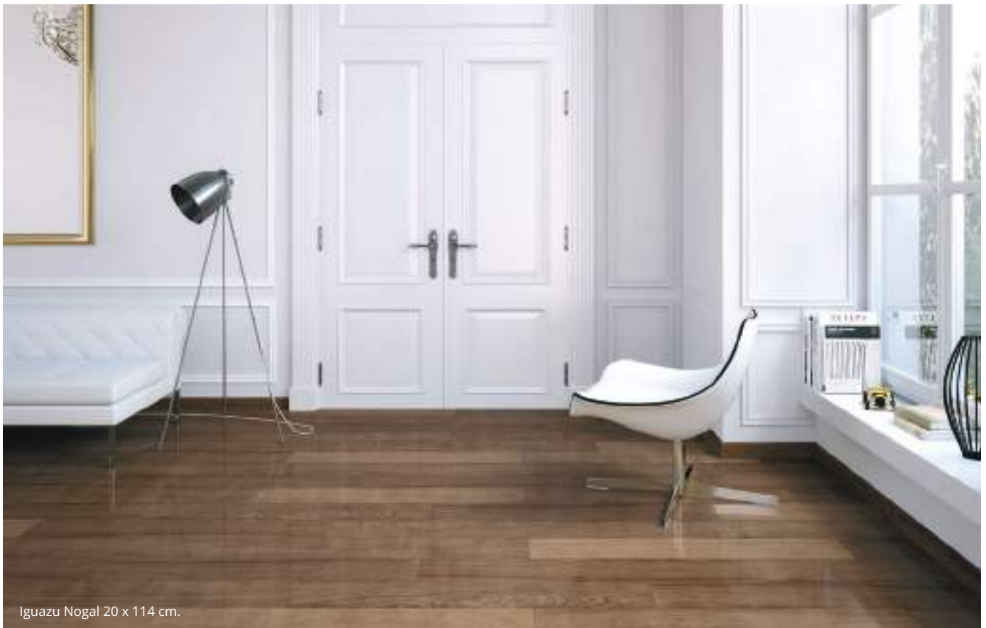
Iguazu Nogal 20 x 114 cm.

Se aconseja uso del Sistema Nivelado We recomend using Levelling System to fix the tiles Ver pág. / See p. 338