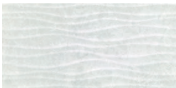
Gris Mosaic RR1903