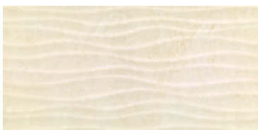
Marfil Mosaic RR1903