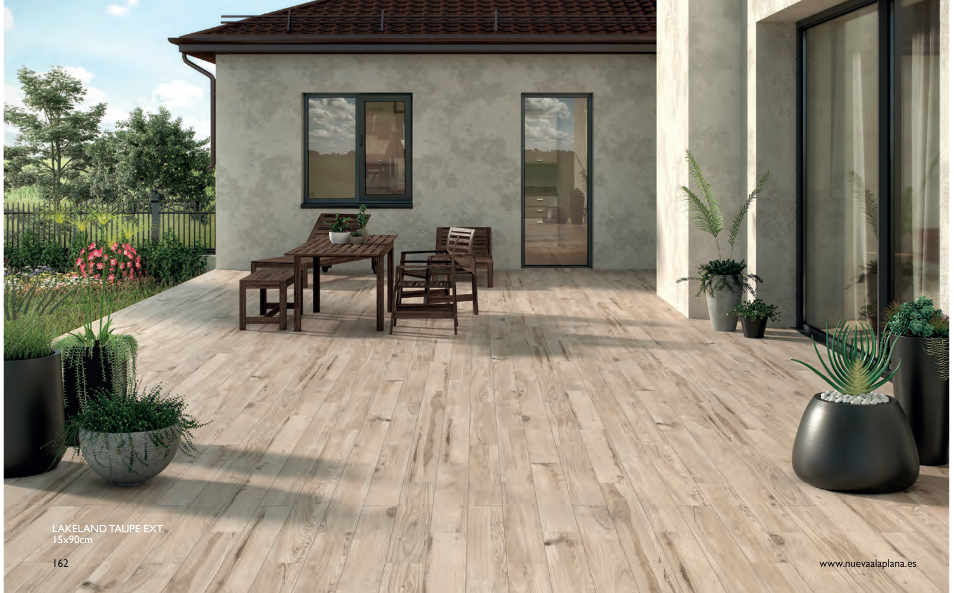
LAKELAND TAUPE EXT. 15x90cm