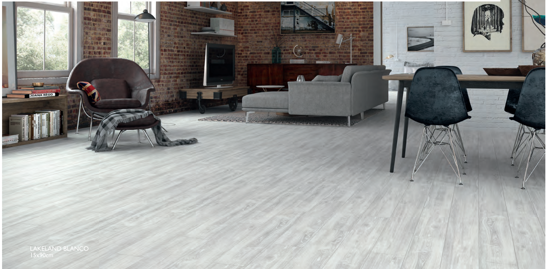
LAKELAND BLANCO 15x90cm