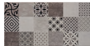
Decorado Lucy Blanco