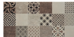
Decorado Lucy Crema