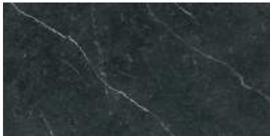
Naxos Black Pulido 60 x 120 cm.