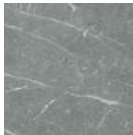
Naxos Grey 60 x 60 cm. Rectificado PR6060L