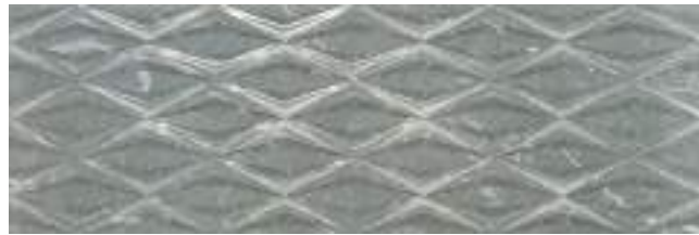
Star Naxos Grey 40 x 120 cm. WB4012RB