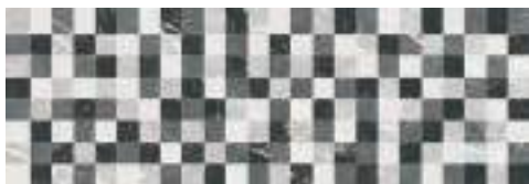
Pixel Naxos Slim 30 x 90 cm. SL3090R