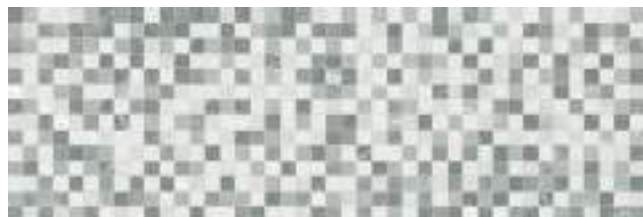
Pixel Naxos 40 x 120 cm. WB4012RB