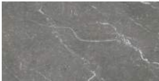
Naxos Grey Pulido 60 x 120 cm.