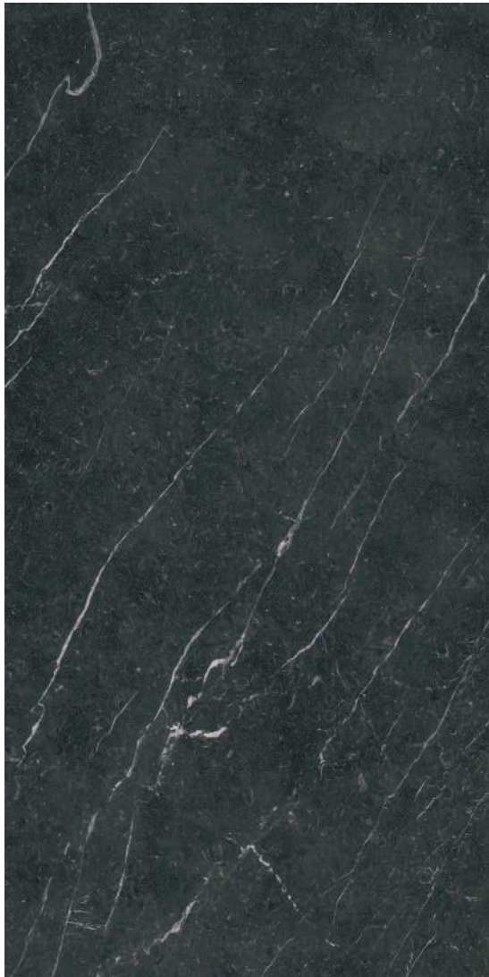
Naxos Black Pulido 240 x 120 cm.