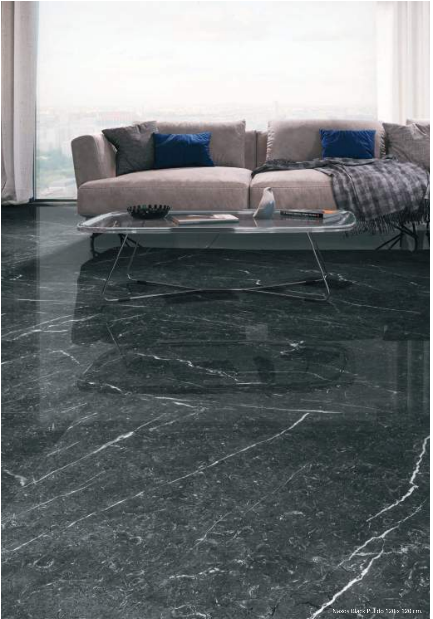
Naxos Black Pulido 120 x 120 cm.