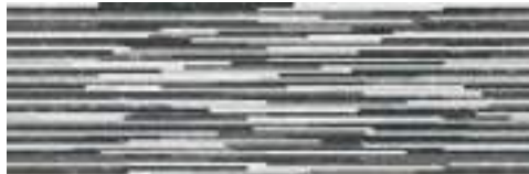
Strix Naxos Slim 30 x 90 cm. SL3090R