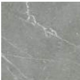
Naxos Steel 60 x 60 cm. Rectificado PR6060L

Pavimento coordinado Coordinated floor tiles