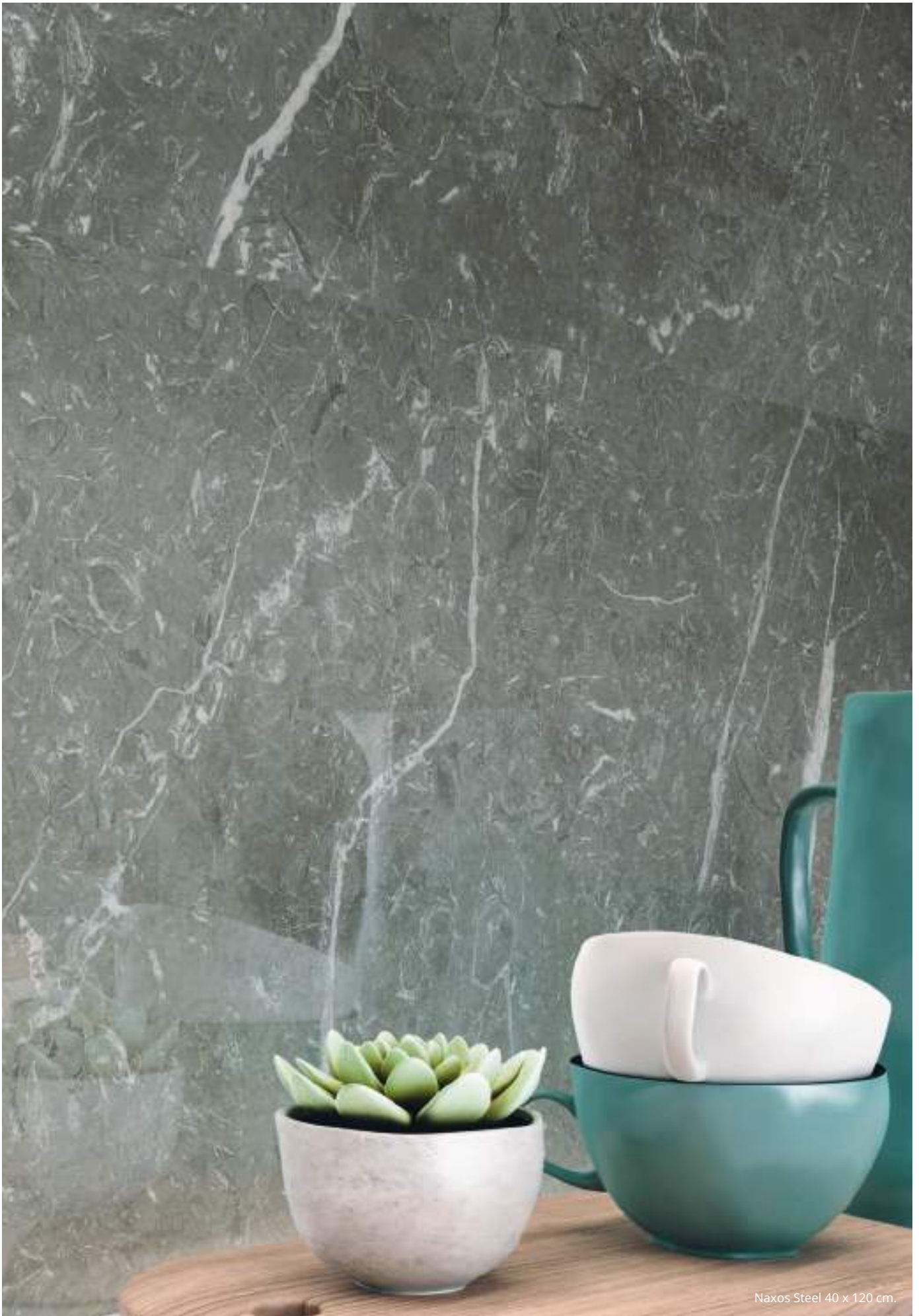
Naxos Steel 40 x 120 cm.