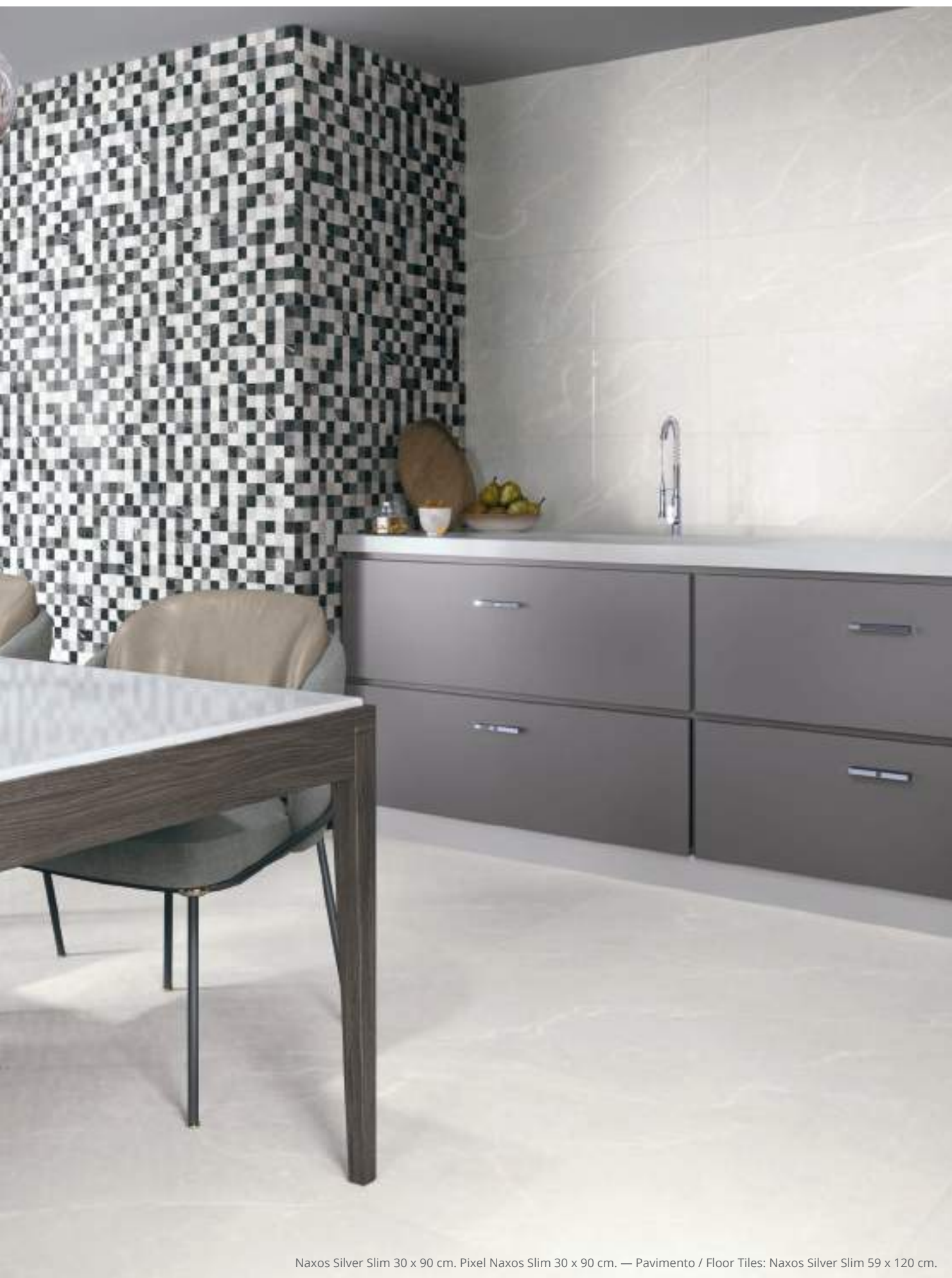
Naxos Silver Slim 30 x 90 cm. Pixel Naxos Slim 30 x 90 cm. — Pavimento / Floor Tiles: Naxos Silver Slim 59 x 120 cm.