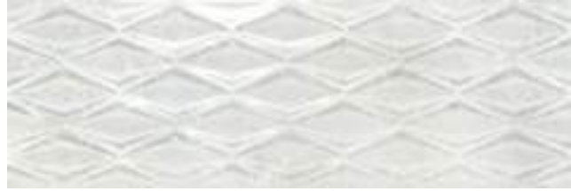
Star Naxos Silver 40 x 120 cm. WB4012RB