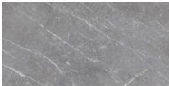
Naxos Steel Pulido 60 x 120 cm.