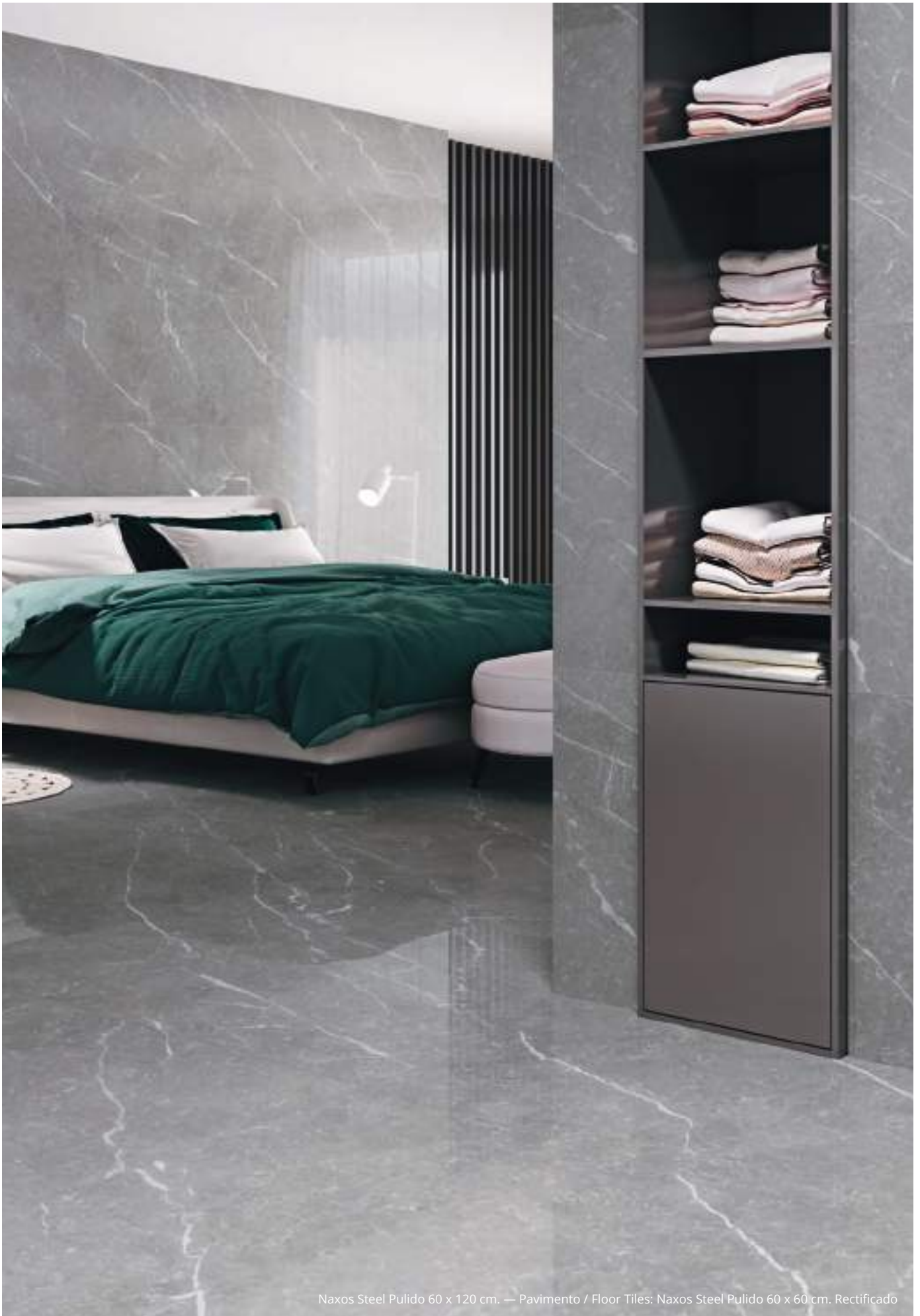
Naxos Steel Pulido 60 x 120 cm. — Pavimento / Floor Tiles: Naxos Steel Pulido 60 x 60 cm. Rectificado