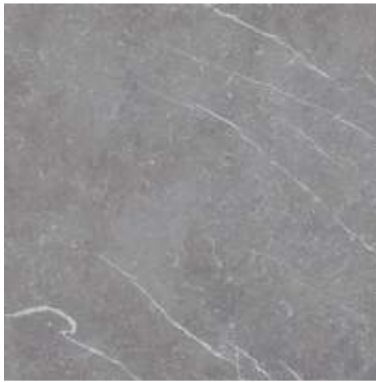
Naxos Steel Pulido 120 x 120 cm.