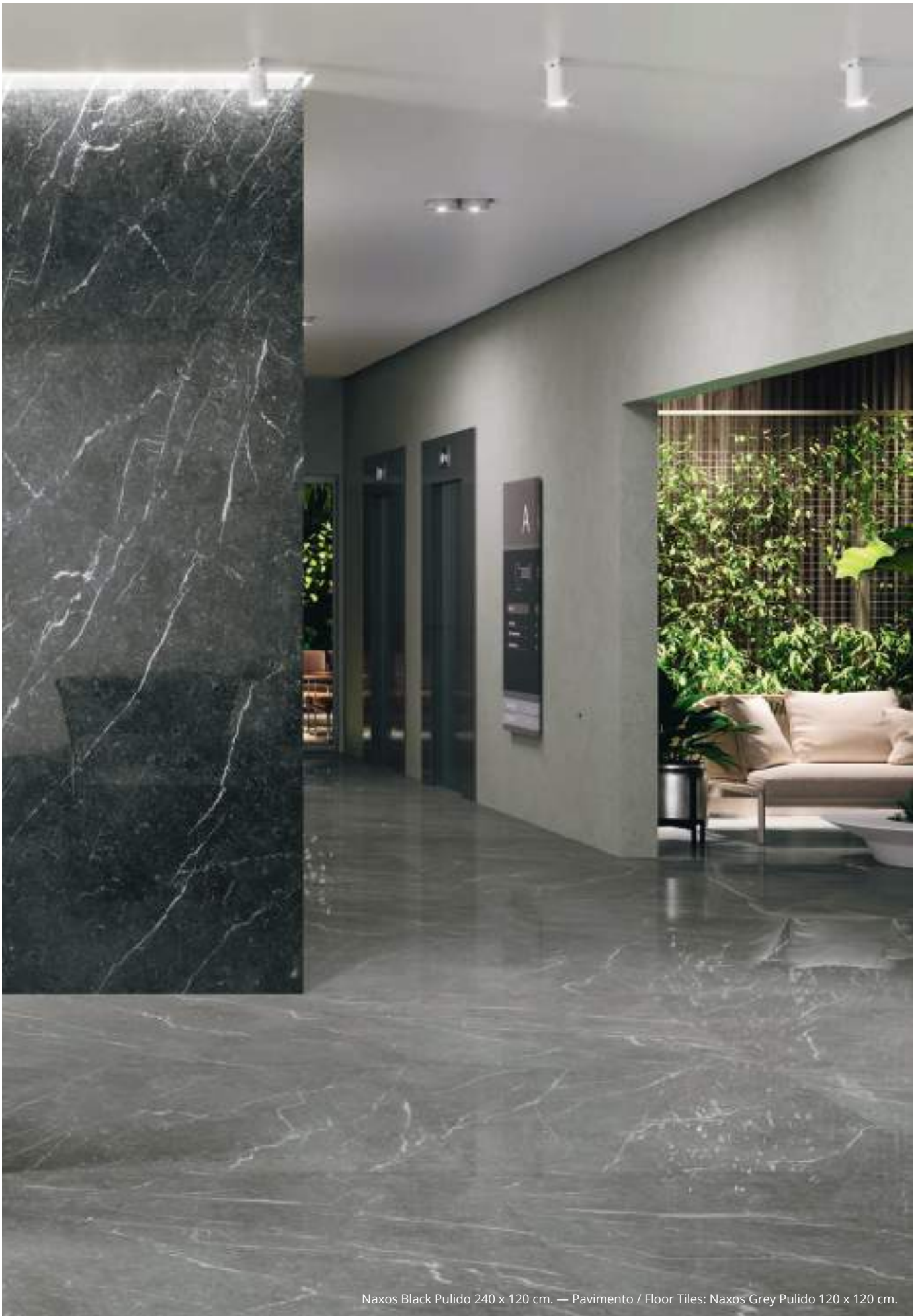
Naxos Black Pulido 240 x 120 cm. — Pavimento / Floor Tiles: Naxos Grey Pulido 120 x 120 cm.