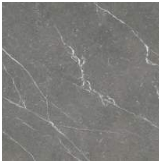
Naxos Grey Pulido 120 x 120 cm.