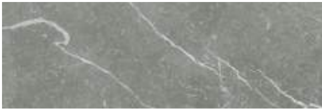
Naxos Steel 40 x 120 cm. WB4012R