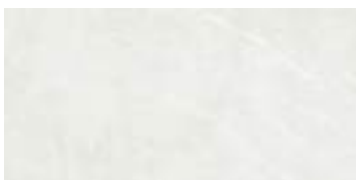
Naxos Silver Pulido Slim 59 x 120 cm. XL5912P Espesor / Thickness — 7 mm.

Pavimento coordinado Coordinated floor tiles