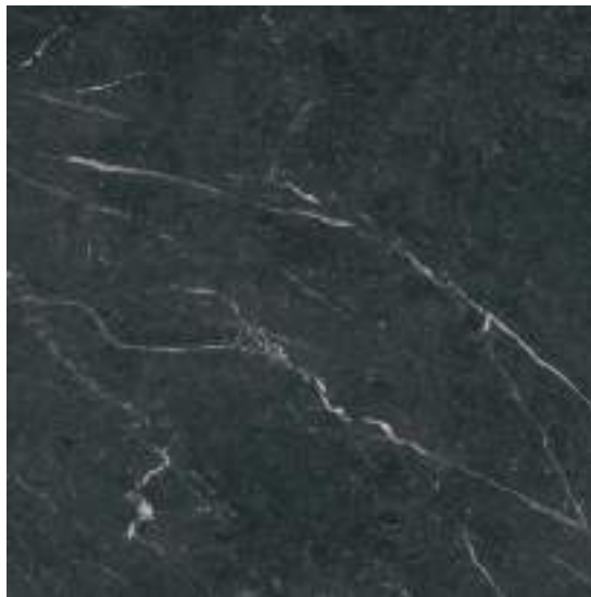
Naxos Black Pulido 120 x 120 cm.