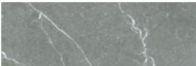
Naxos Grey 40 x 120 cm. WB4012R