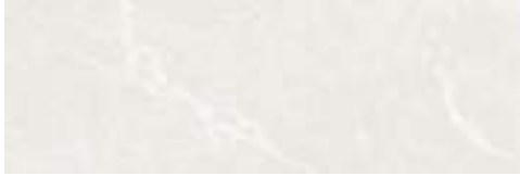
Naxos Silver Slim 30 x 90 cm. SL3090LB

240 x 120 cm. — 94,48" x 47,24" 120 x 120 cm. — 47,24" x 47,24" 60 x 120 cm. — 23,62" x 47,24" 59 x 120 cm. Slim — 23,22" x 47,24" 60 x 60 cm. — 23,62" x 23,62" 40 x 120 cm. — 15,75" x 47,24" 30 x 90 cm. Slim — 11,81" x 35,43"