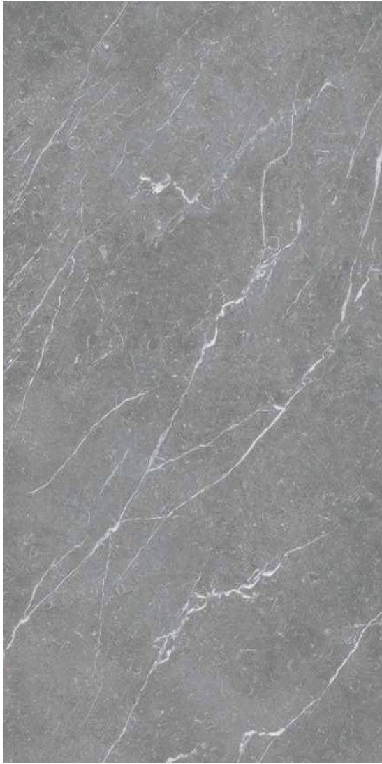
Naxos Steel Pulido 240 x 120 cm.