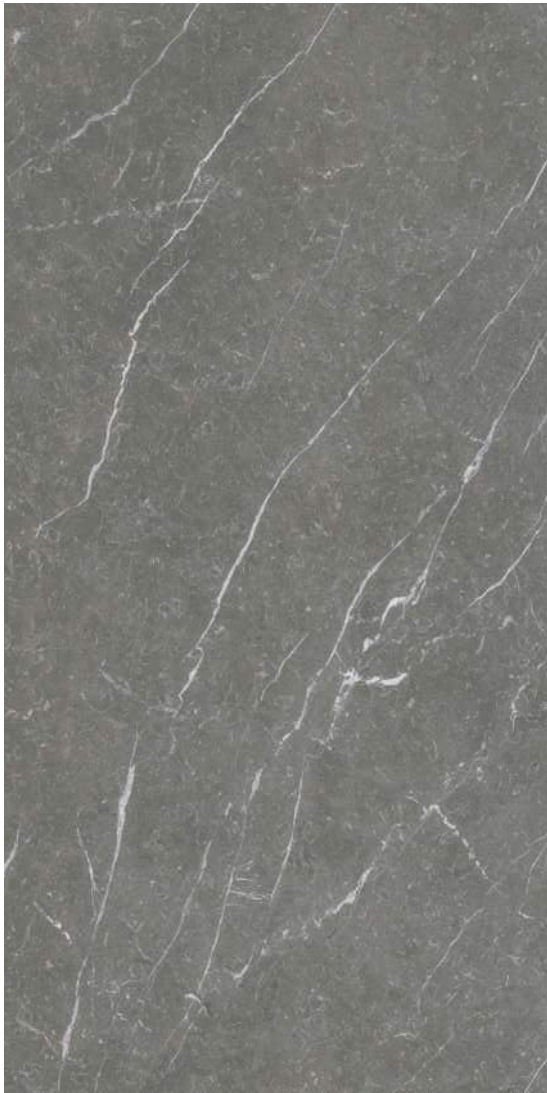
Naxos Grey Pulido 240 x 120 cm.