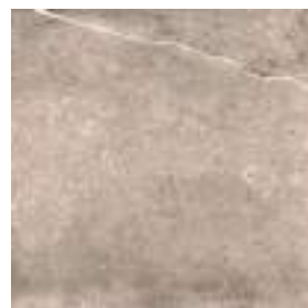
Nickon Taupe 60 x 60 cm. Rectificado PR6060L