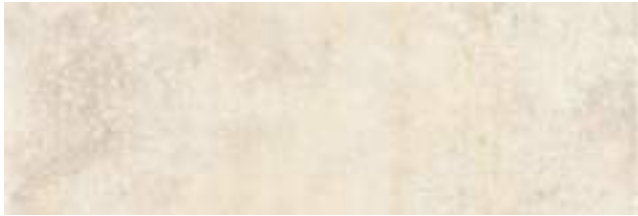
Nickon Bone 40 x 120 cm. WB4012L

Modelo creado con diversidad de gráficas. Model created with graphs diversity.