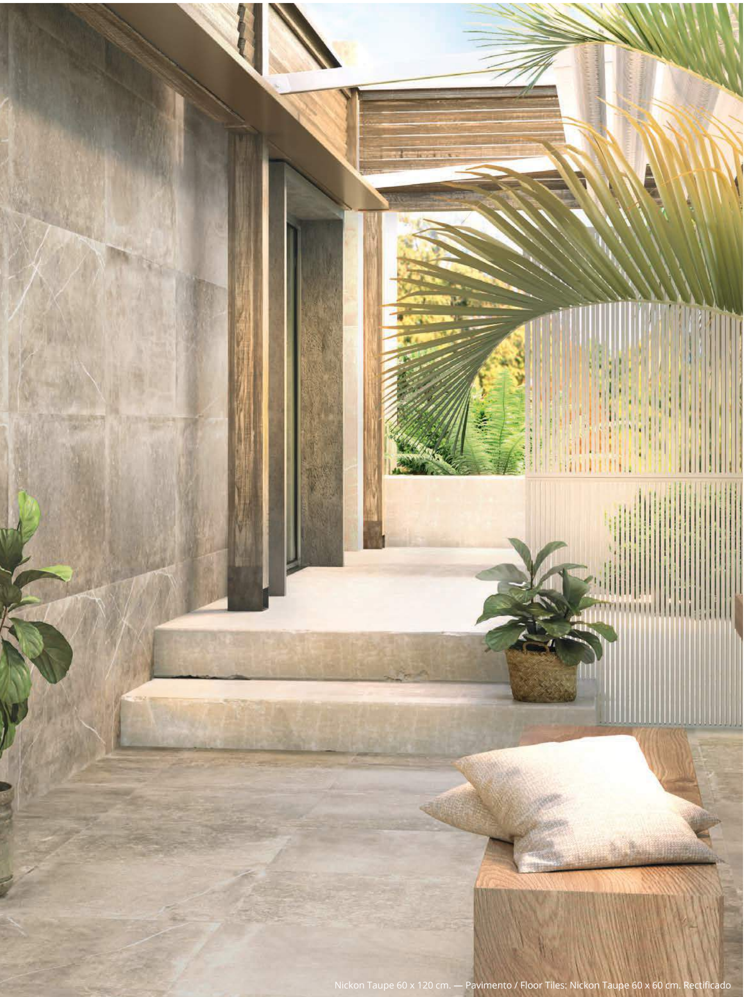
Nickon Taupe 60 x 120 cm. — Pavimento / Floor Tiles: Nickon Taupe 60 x 60 cm. Rectificado