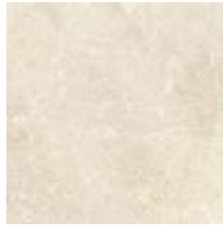
Nickon Bone 60 x 60 cm. Rectificado