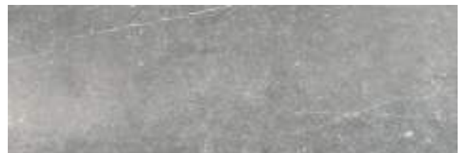
Nickon Chrome 40 x 120 cm. WB4012L