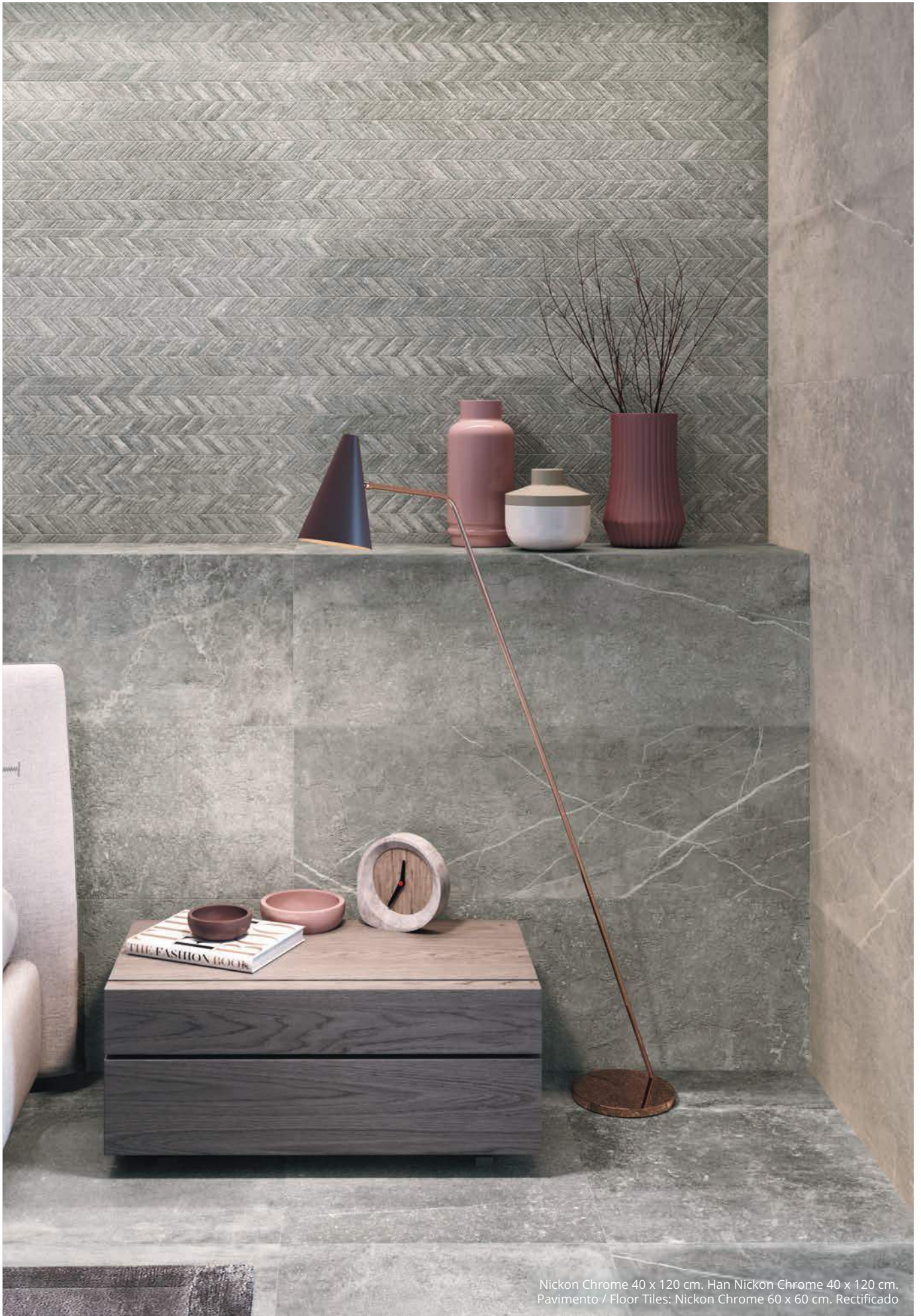
Nickon Chrome 40 x 120 cm. Han Nickon Chrome 40 x 120 cm. Pavimento / Floor Tiles: Nickon Chrome 60 x 60 cm. Rectificado