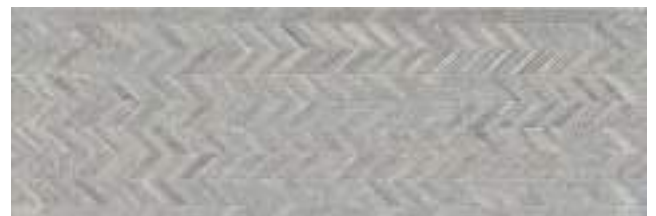
Han Nickon Chrome 40 x 120 cm. WB4012R