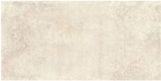
Nickon Bone 60 x 120 cm.

Modelo creado con diversidad de gráficas. Model created with graphs diversity.