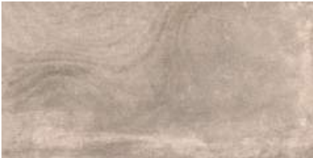
Nickon Taupe 60 x 120 cm.