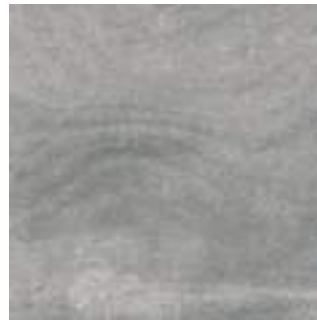
Nickon Chrome 60 x 60 cm. Rectificado