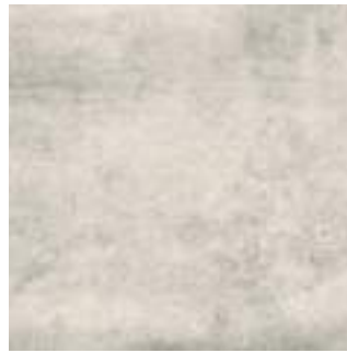
Nickon Steel 60 x 60 cm. Rectificado