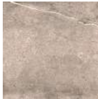
Nickon Taupe 60 x 60 cm. Rectificado