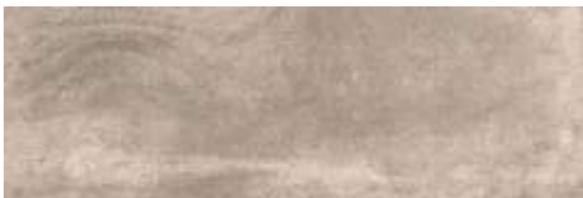
Nickon Taupe 40 x 120 cm. WB4012L