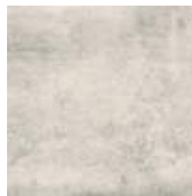
Nickon Steel 60 x 60 cm. Rectificado PR6060L