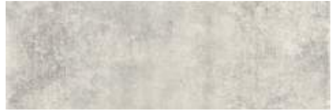
Nickon Steel 40 x 120 cm. WB4012L