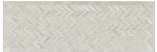
Han Nickon Steel 40 x 120 cm. WB4012R