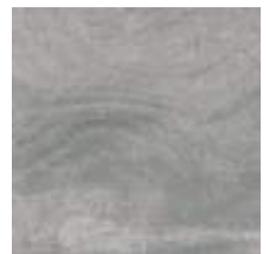
Nickon Chrome 60 x 60 cm. Rectificado PR6060L