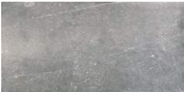
Nickon Chrome 60 x 120 cm.