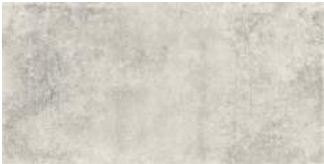
Nickon Steel 60 x 120 cm.