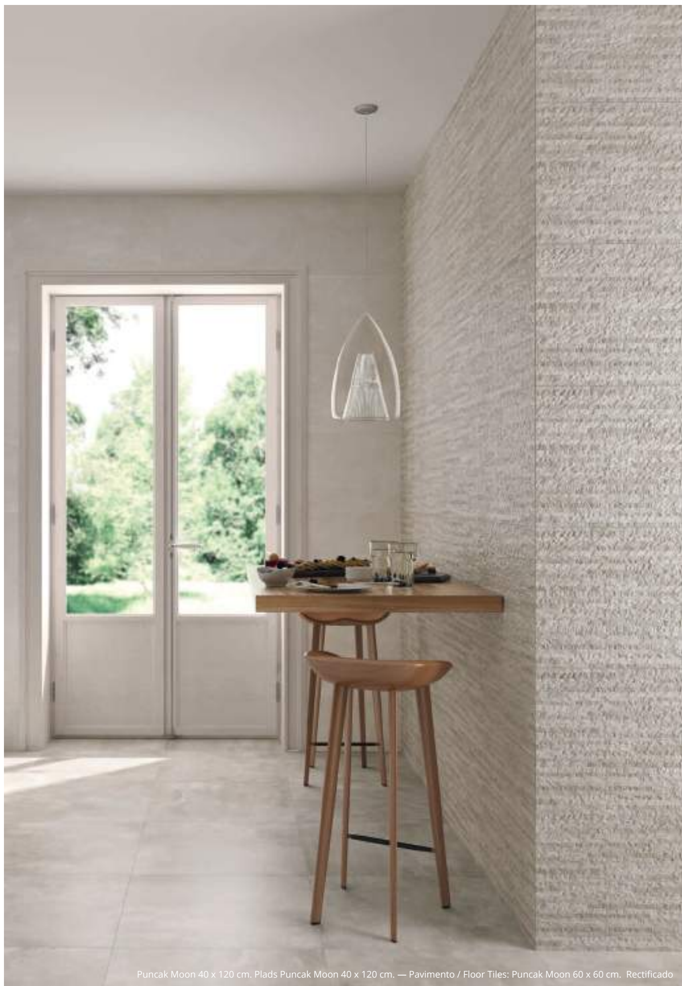
Puncak Moon 40 x 120 cm. Plads Puncak Moon 40 x 120 cm. — Pavimento / Floor Tiles: Puncak Moon 60 x 60 cm. Rectificado