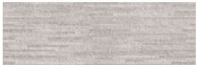
Plads Puncak Moon 40 x 120 cm. WB4012LB