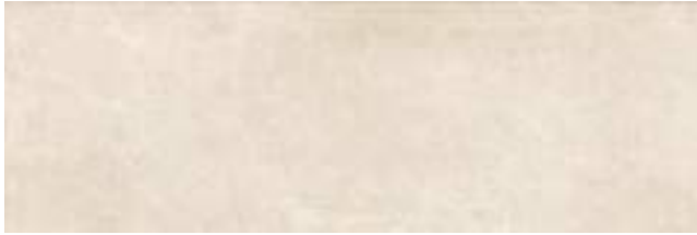
Puncak Ivory 40 x 120 cm. WB4012L