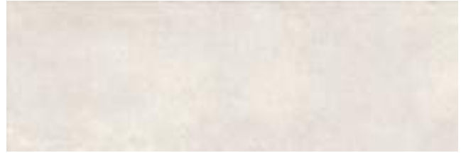
Puncak Silver 40 x 120 cm. WB4012L