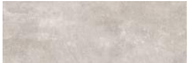
Puncak Moon 40 x 120 cm. WB4012L