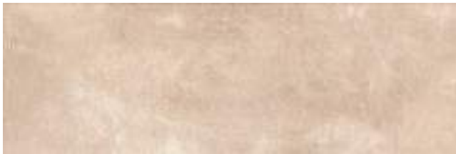
Puncak Taupe 40 x 120 cm. WB4012L