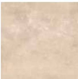
Puncak Taupe 60 x 60 cm. PR6060L Rectificado

Pavimento coordinado Coordinated floor tiles