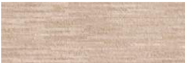
Plads Puncak Taupe 40 x 120 cm. WB4012LB