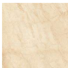
Savana Cream 44,7 x 44,7 cm.

Pavimento coordinado Coordinated floor tiles