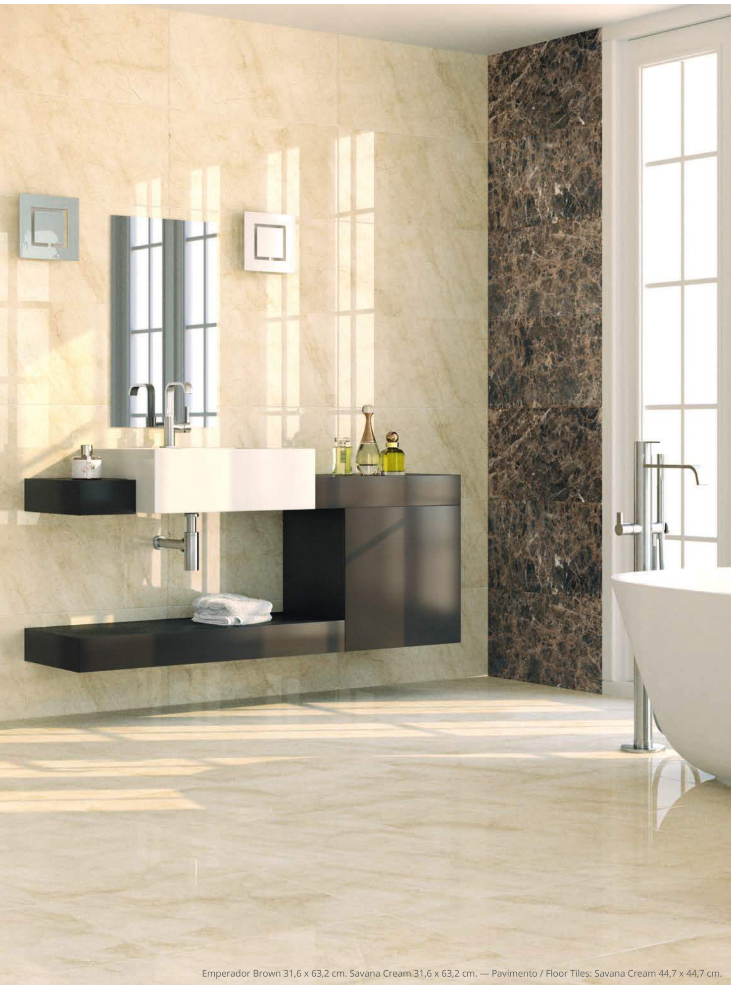
Emperador Brown 31,6 x 63,2 cm. Savana Cream 31,6 x 63,2 cm. — Pavimento / Floor Tiles: Savana Cream 44,7 x 44,7 cm.