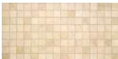
Mosaico Savana Cream 31,6 x 63,2 cm.