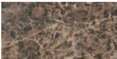
Emperador Brown 31,6 x 63,2 cm.