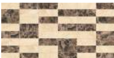
Losetas Savana Emperador 31,6 x 63,2 cm.