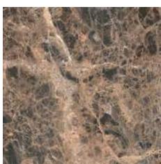
Emperador Brown 44,7 x 44,7 cm.