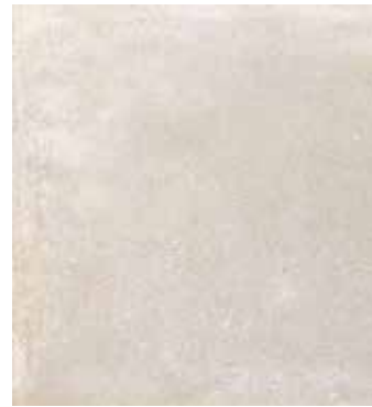
Perla NCS S 1500-N

*Posibilidad de tratamiento C2/C3 sobre el acabado natural. Consulte condiciones. Este tratamiento puede producir cambio de color en las tonalidades oscuras. *Possibility to get C2/C3 anti-slip rating for Nat finish. Check conditions. This process may generate shade variation in dark colours. *Possibilité de traitement C2/C3 sur la finition naturelle. Consultez les conditions. Ce traitement peut produire un changement de couleur dans les tons foncés.