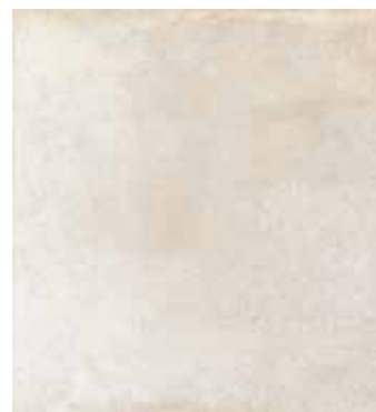
Arena NCS S 2005-T20R