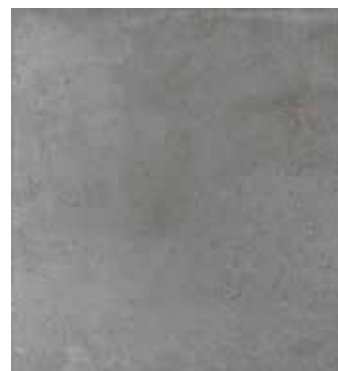
Grafito NCS S 5000-N P cb