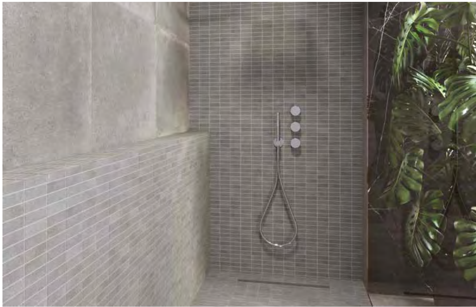
Wall and Floor tile Oristan Gris 60x60 and Oristan Gris mosaico 30x30 (2,5x7)