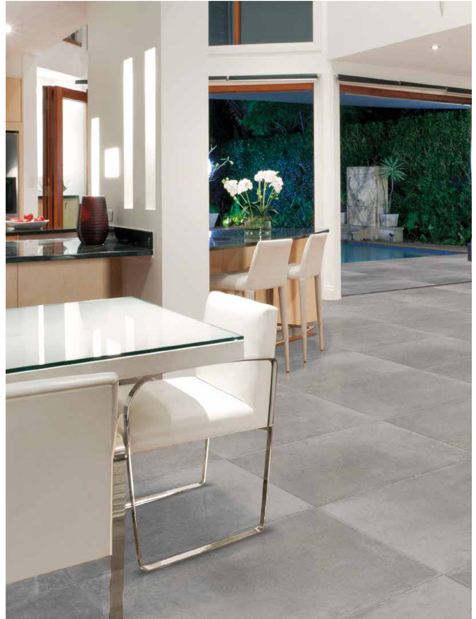
Floor tile Oristan Gris 60x60 .