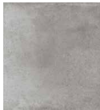
Gris NCS S 3500-N