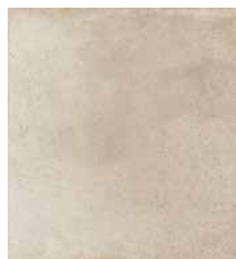
Piedra NCS S 2005-Y40R